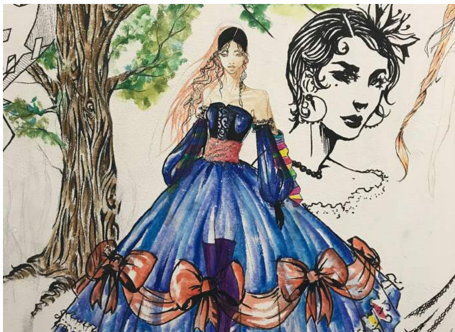
Dessin réalisé par des élèves de la section STD2A